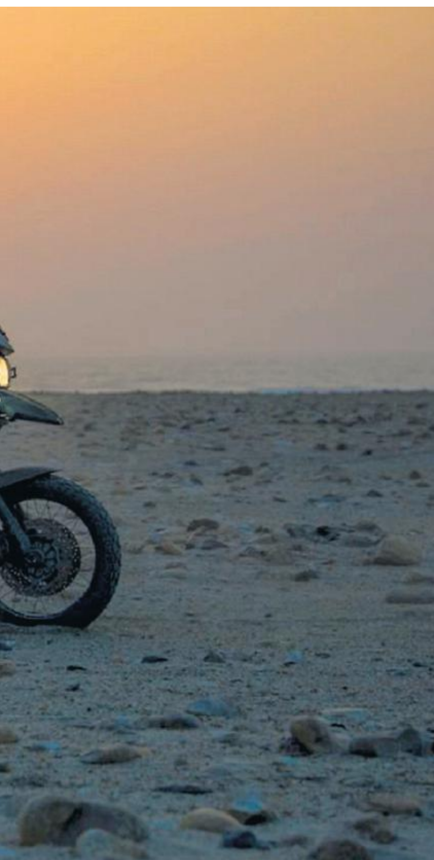
søkte å flytte kjøretøyene.