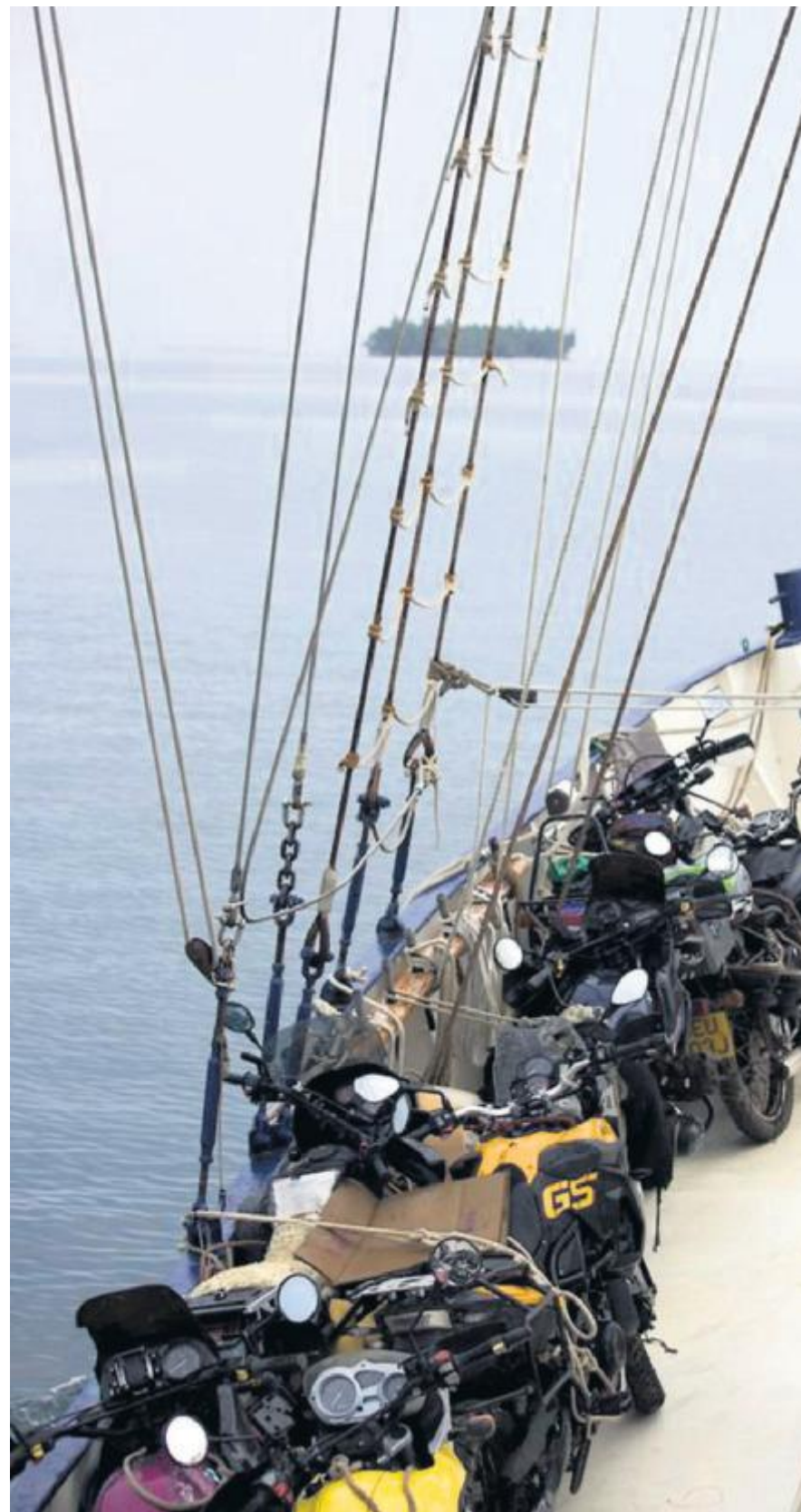
SEILING. Seilbåten som fraktet gjengen fra Panama til Colombia het Staahlratte. Før het båten Sildaskjær, og var stasjonert fiskebåt i Måløy. Ombord er det 14 motorsyklar.

– Det gikk overraskende enkelt. Verden er ikke så farlig som man kanskje tror.