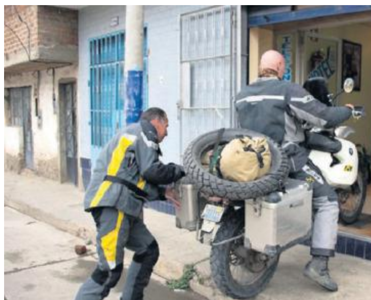
PARKERING. På flere titalls hoteller fikk karene parkere motorsykkene i resepsjonen, til og med på finere hoteller.